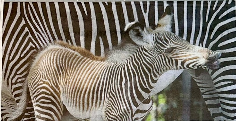
La piccola zebra di Grevy, a rischio estinzione, nata al Bioparco