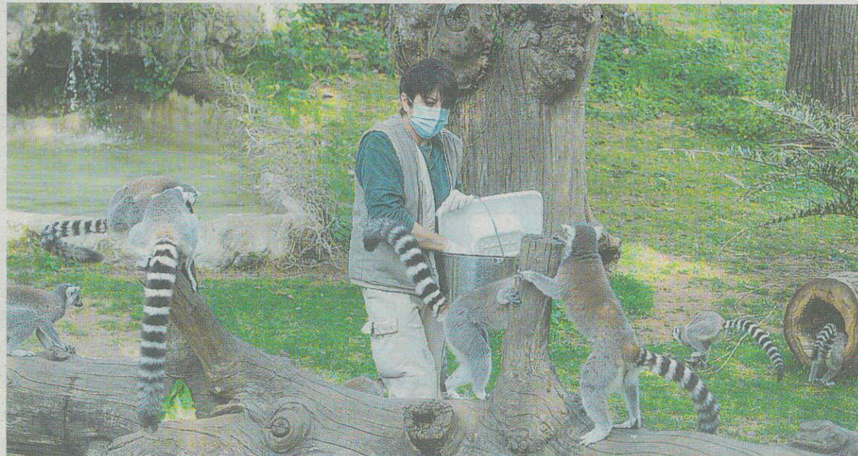
Cibo Gli addetti del parco zoologico svolgono tutte le normali mansioni con mascherina e guanti di protezione

Ci sono solo gli animali nel Bioparco, chiuso come tutto per l'emergenza sanitaria, gli operatori divisi in due turni li curano anche più di prima. «In una domenica bella come questa - racconta Francesco Petretti, presidente della Fon-